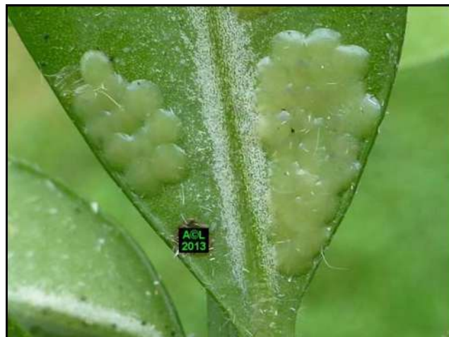
Œufs de pyrale du buis