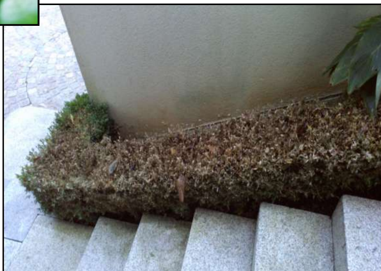
Dégâts de pyrale du buis sur buis de bordure

Retrouvez les BSV sur le site de la Chambre Régionale d'Agriculture ou le site de la DRAAF www.bulletinduvegetal.synagri.com http://draf.bretagne.agriculture.gouv.fr