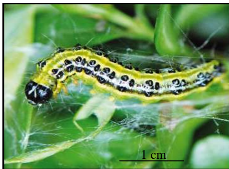
Une chenille de pyrale du buis

Dégâts et plantes hôtes P3 Situation sanitaire Moyens de lutte