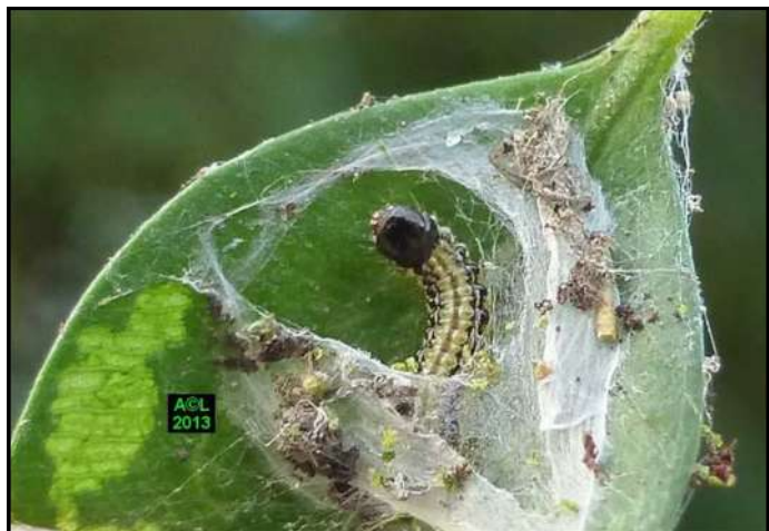
Chenille de pyrale du buis dans son logis hivernal