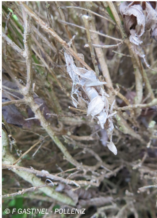
Chrysalide vide - pyrale du buis (18/06/2019)