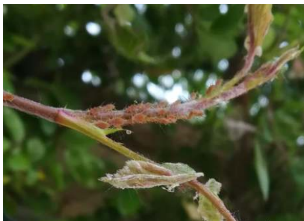
Photo : Puceron du rosier ( Macrosiphum rosae ) sur jeune pousse de rosier