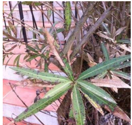
Photo : Taches foliaires du laurier rose

Ce champignon se manifeste par l'apparition de taches nécrotiques brun clair entourées d'un anneau pourpre sur les feuilles. Il peut considérablement affaiblir les plantes atteintes et se transmet par la pluie, les arrosages ou les outils de taille .