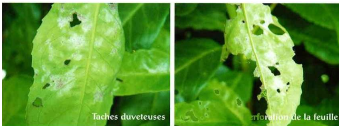
Photo : Symptômes d'oïdium perforant

Quelques méthodes culturales permettent de prévenir le développement de l'oïdium : une bonne gestion de la fertilisation , une taille régulière mais pas trop sévère permettant de favoriser la circulation de l'air dans le cœur de la haie et un arrosage localisé au pied des arbres.