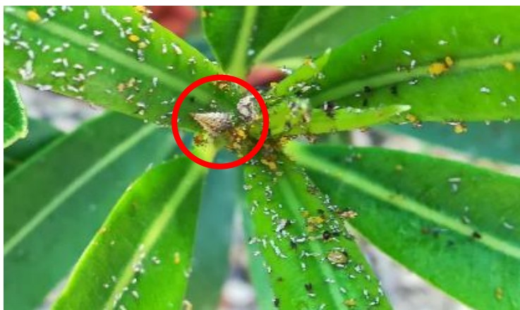
Photo : Larve de chrysope se nourrissant de pucerons sur laurier rose