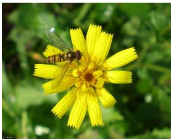
Photo : Larve de syrphid au milieu de puceron (FREDON Paca) et adulte (Chamont INRA)