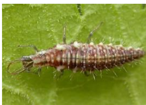
Photo : Œufs de chrysope au bout de leur pédicelle et larve de chrysope en gros plan