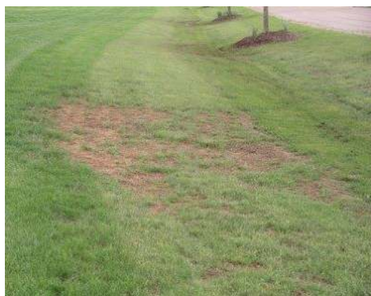
Photo : Dommages de tipules sur un gazon. ( http://www.omafr.gov.on.ca/ )

Les tipules sont des diptères , ils ressemblent à de grands moustiques encore appelés communément « cousins ». Il existe plusieurs espèces différentes de tipules qui peuvent faire des dégâts, mais la principale est la tipule des prairies Tipula paludosa . Les adultes se nourrissent seulement d'eau et de sucs. Les larves sont de gros asticots cylindriques qui mesurent 3 à 4 cm de long et sont de couleur gris-terreux . Leur peau est lisse et très dure. Ils se nourrissent dans la couche superficielle du sol pendant la nuit, et consomment les radicelles et les collets provoquant le dépérissement des plantes. Le gazon jaunit, se soulève et se dénude .