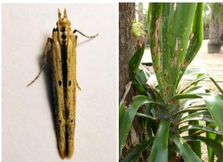
Photo : Adulte et dégâts de Batrachedra enormis (Chris Mallory et Sauvons nos Palmiers)

Ce n'est pas l'insecte en soit qui provoque la mort du végétal, mais les champignons qui pénètrent par les trous forés par la chenille.